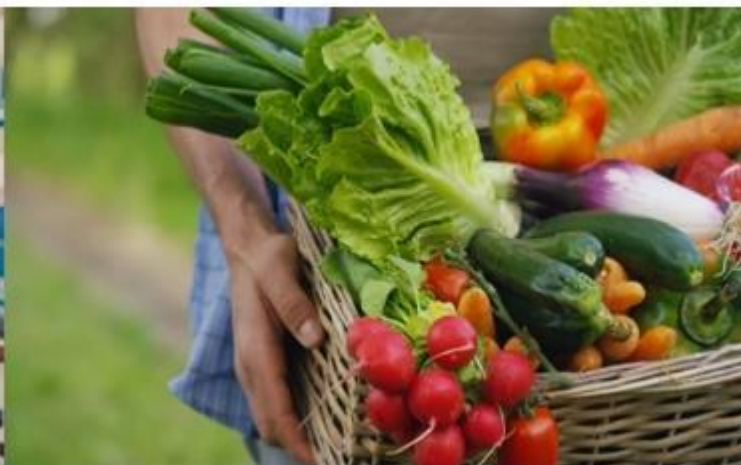
ŻYWNOŚĆ WYSOKIEJ JAKOŚCI