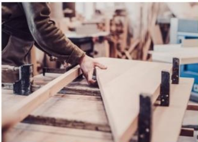
DREWNO I MEBLARSTWO